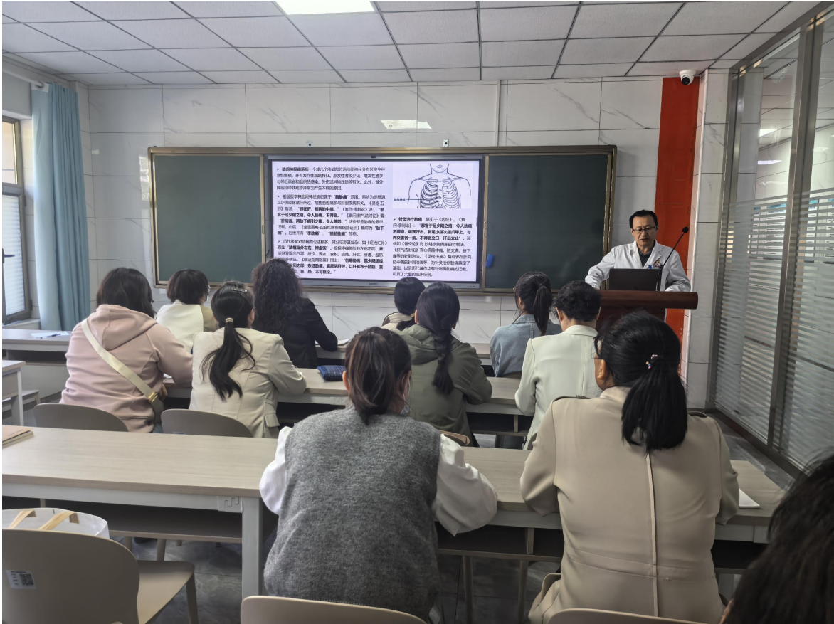
2024 年高血压指南解读